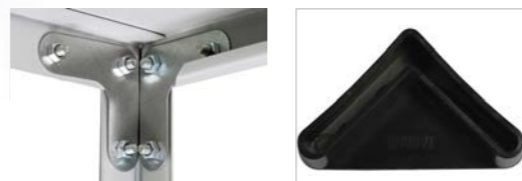
Комплект Г-образного крепежа стойки Подпятник пластиковый